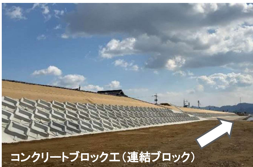
コンクリートブロック工(連結ブロック)