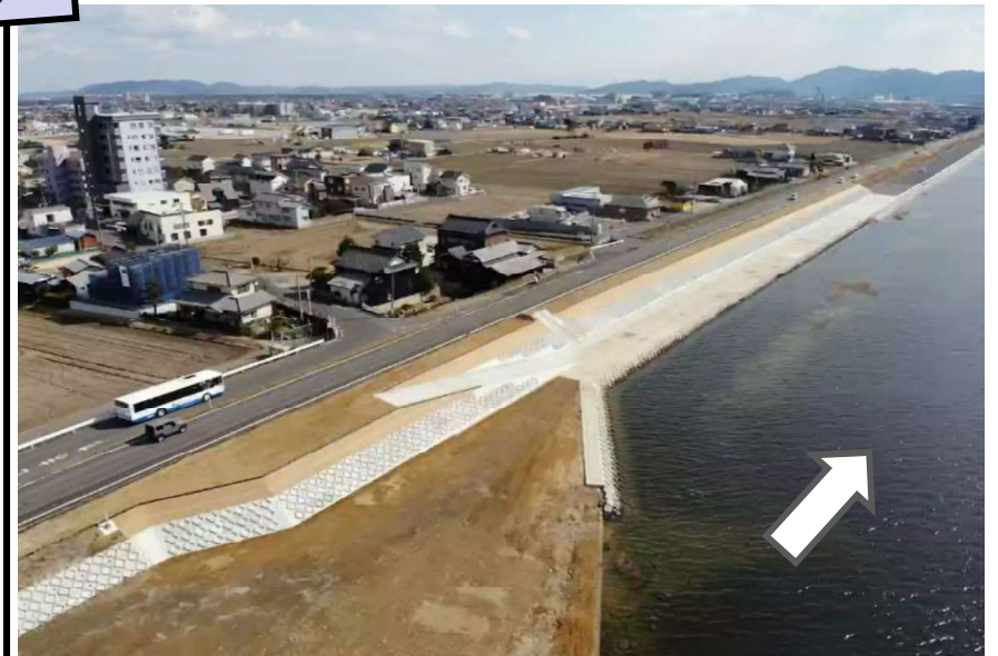
整備状況 令和5年2月