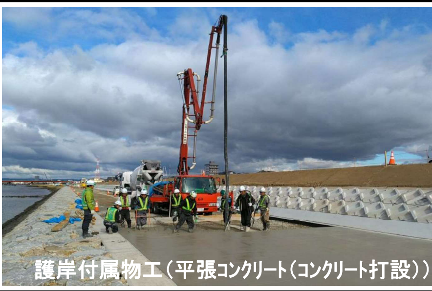
護岸付属物工(平張コンクリート(コンクリート打設))