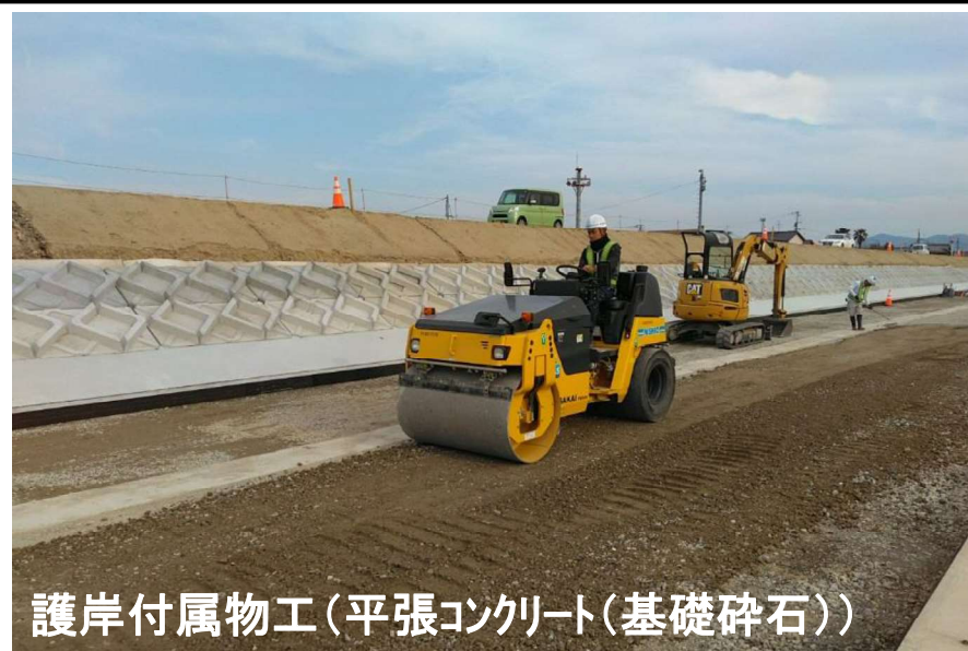
護岸付属物工(平張コンクリート(基礎砕石))