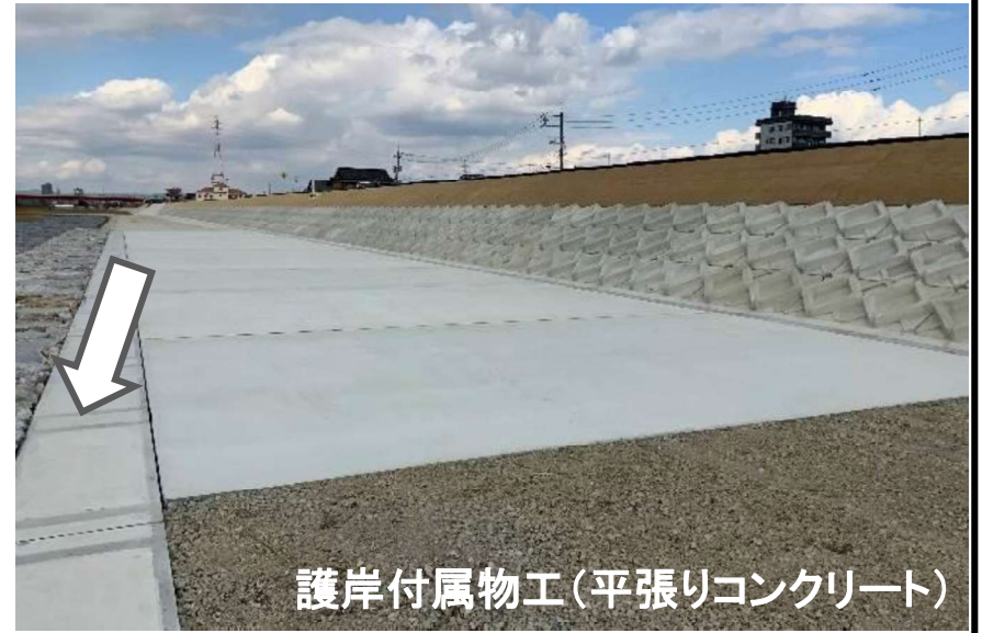
護岸付属物工(平張りコンクリート)