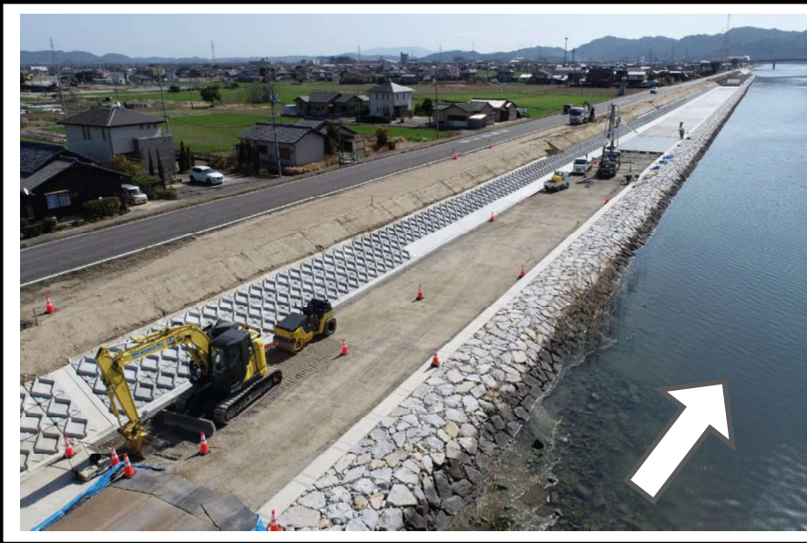
整備状況 令和6年2月末