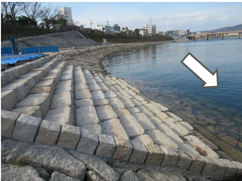
整備状況 令和5年2月