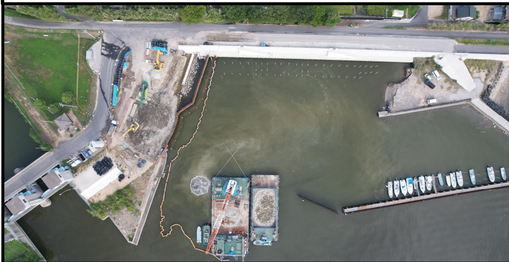
施工状況 令和7年10月