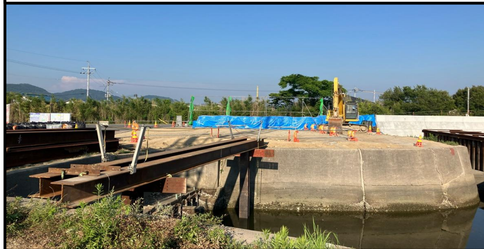
施工状況 令和7年6月