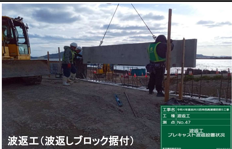
施工状況 令和6年2月