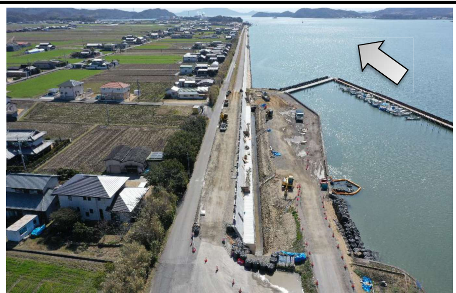
整備状況 令和6年2月末