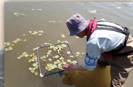
アサザ生育状況調査