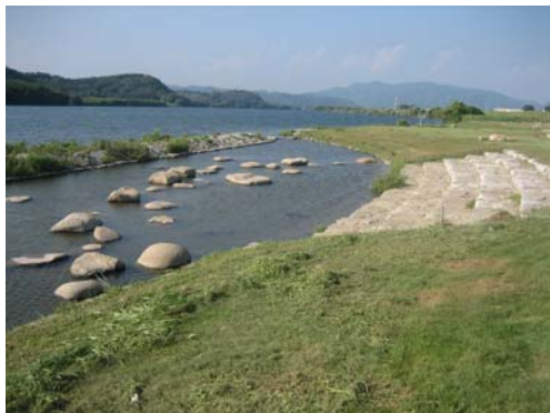
親水池・親水階段