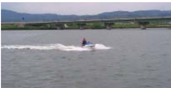
ジェットスキーデモ