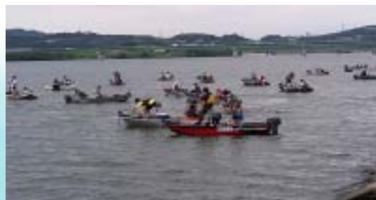
バスフィッシング