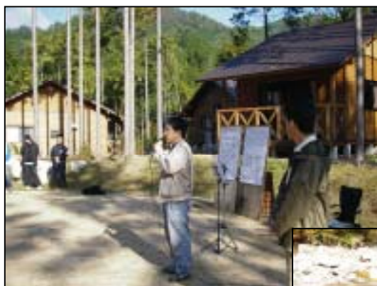
岡山河川事務所からも参加！