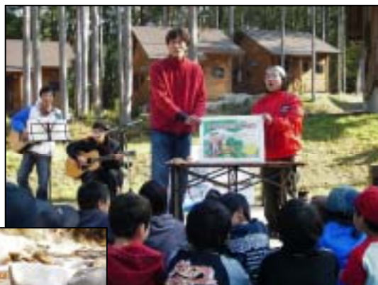
森を大切に！！ 紙芝居