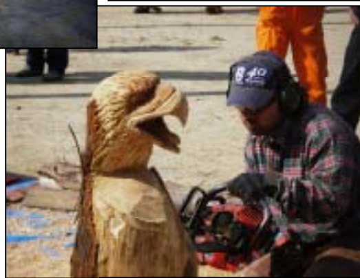
チェーンソーアート 見事！