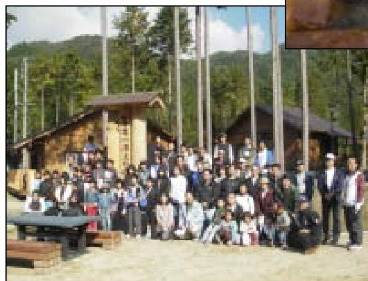
参加者全員で記念撮影！