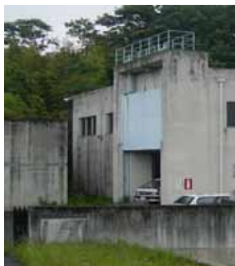
【開扉状況(通常時は上に吊り上げている)】【閉扉完了状況(外観)】