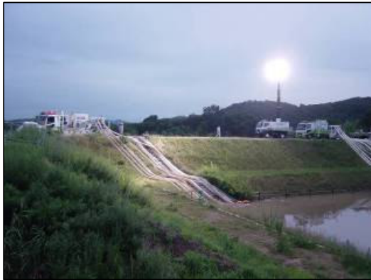
災害時の使用状況