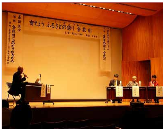
レトロな雰囲気が漂う倉敷公民館でシンポジウムが開催されました