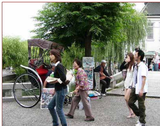
当日、倉敷川を中心とした美観地区には多くの観光客が訪れていました