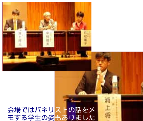
会場ではパネリストの話をもめる学生の姿もありました