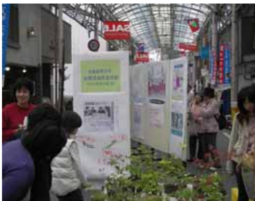
【吉備国際大学による河川水質調査結果等のパネル展示状況】