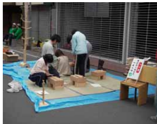
【マイ箸作りの状況】