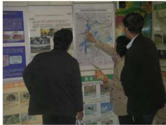
岡山河川事務所の出展風景