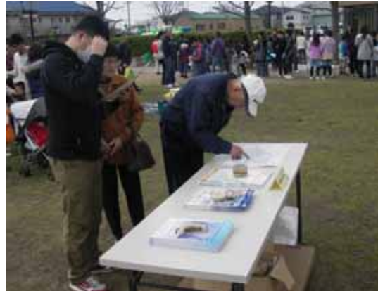
【国土交通省ブースの状況】