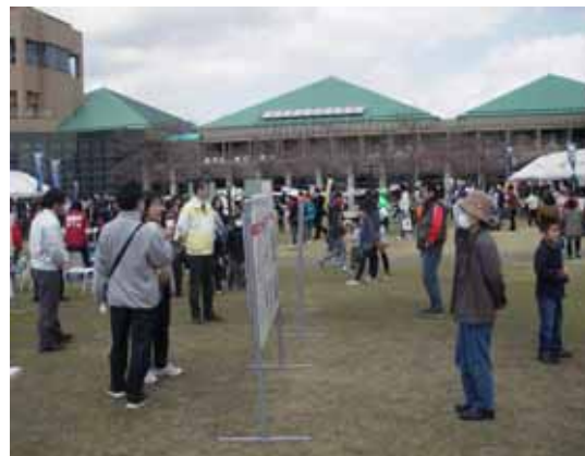
【国土交通省ブースでのパネル展示状況】