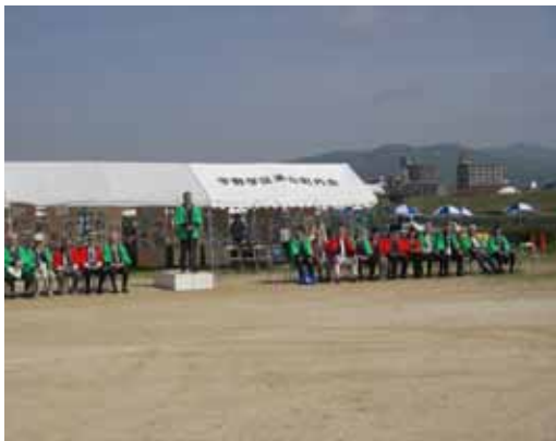
開会式事務所長挨拶