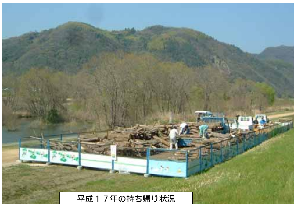
平成17年の持ち帰り状況

伐採木のほとんどはヤナギで、薪や炭焼き、平茸のほだ木などいろいろな用途に利用できます。また、高梁川については木材チップも無料で提供します。木材チップはマルチング材等に利用できます。