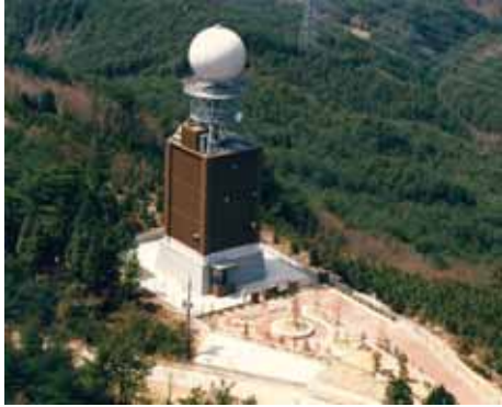
大和山レーダ雨量観測所 吉備中央町 大和山山頂 標高 603m