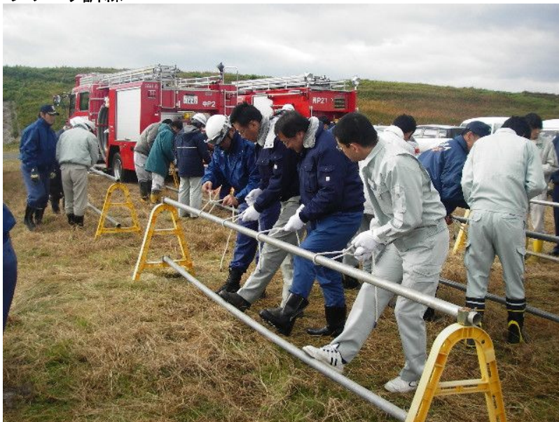
ロープワーク訓練