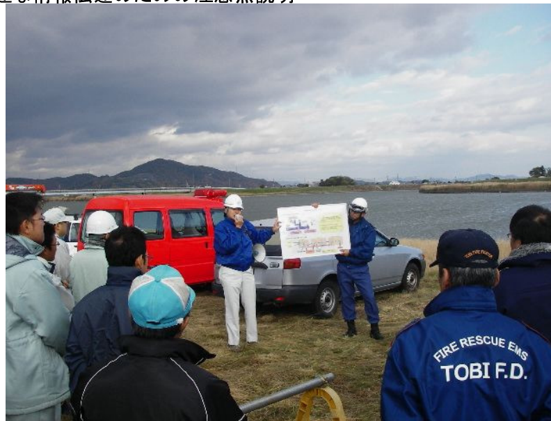
迅速な情報伝達のための注意点説明