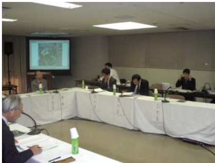
(H21.10.16 第3回 開催状況)

この整備計画を策定するにあたり、専門的知識を有する学識経験者のご意見をいただく場として、下記のとおり第4回「明日の高梁川を語る会」を開催します。