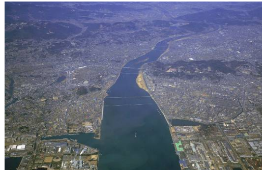
(高梁川を河口よりのぞむ)