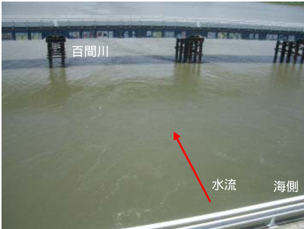
4号堰柱から百間川を撮影