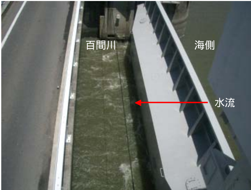
4号堰柱から3号ゲ-トを撮影