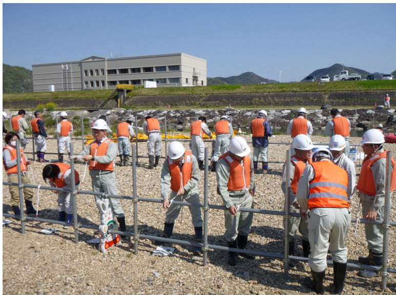
オイルフェンス展張訓練