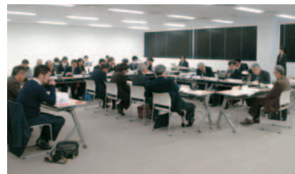
第2回明日の吉井川を語る会開催状況