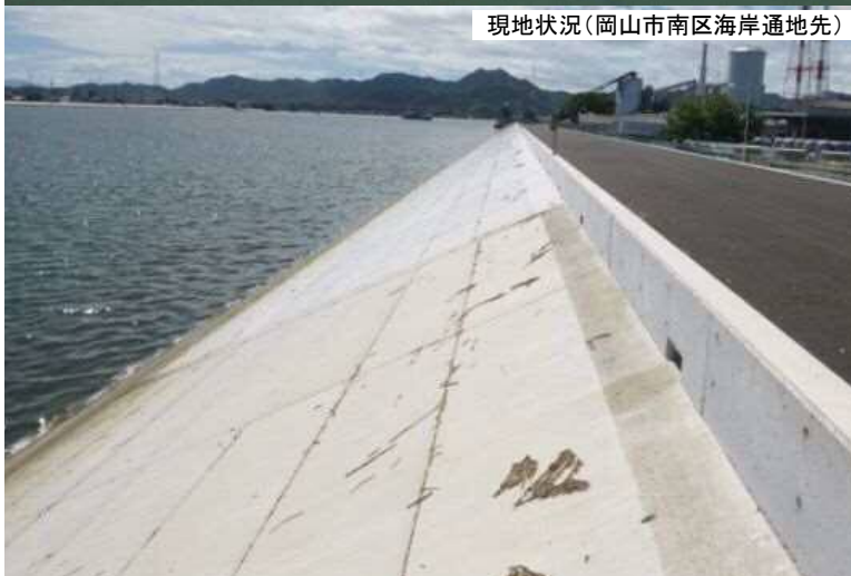
現地状況(岡山市南区海岸通地先)