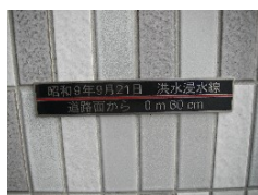
昭和9年9月浸水水位 表示プレート

現地視察では事業の紹介、過去の 堤防決壊箇所やその時の浸水水 位、現状で堤防決壊が発生した場 合の浸水水位表示等を説明予定