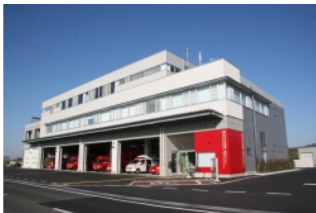
岡山市中消防署・水防センター