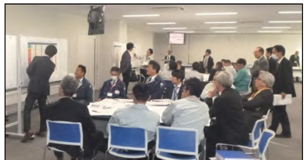
前回(平成28年12月6日)の検討会状況