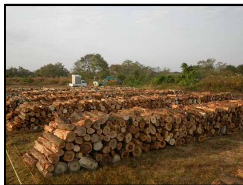
配布場所の整理状況 (前回配布時)