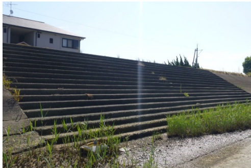
漕艇部が使用していた改修前の階段