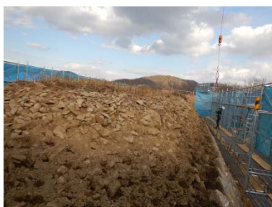
一の荒手 亀の甲（解体状況）