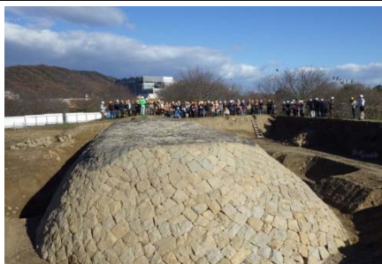
一の荒手 亀の甲（解体前）