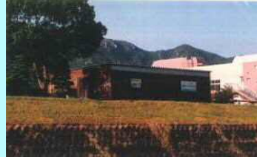
市民団体による活動拠点の整備事例（佐波川）

※ 河川管理者から河川管理施設の維持、除草等の委託を受けることも可能となります。委託先については、公募等の適正な手続きを経て選定を行う予定です。