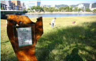
市民団体による看板設置事例（太田川）