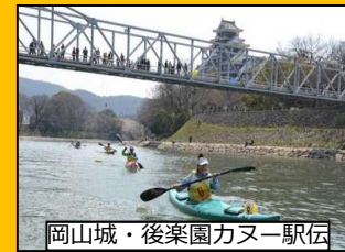
岡山城・後楽園カヌー駅伝