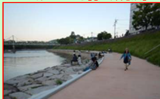
親水護岸整備(国交省)