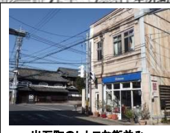
出石町のレトロな街並み