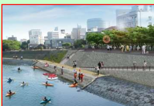
カヌー等が発着できる親水護岸整備