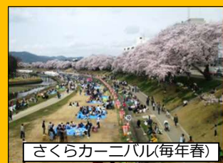
さくらカーニバル(毎年春)