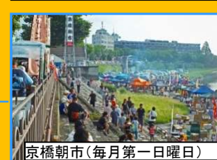
京橋朝市(毎月第一日曜日)