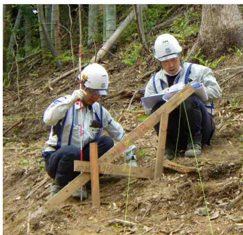
【従来施工の丁張り状況】