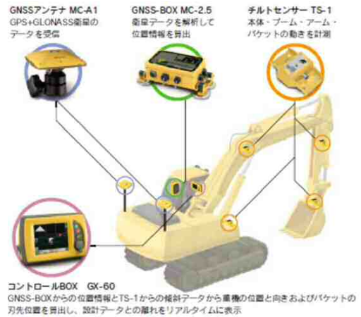
【ICT 建設機械の装備品】