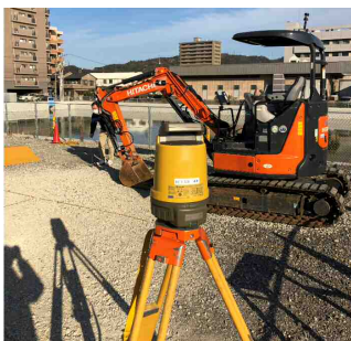
【ICT 小規模土工施工状況】