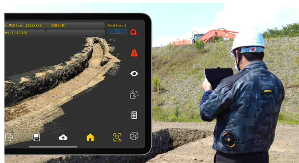
【モバイル端末による3D計測状況】