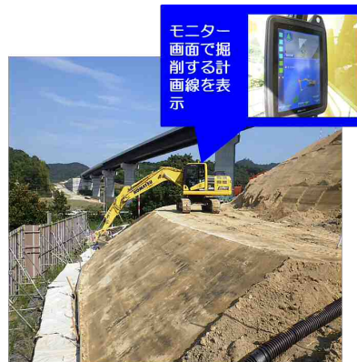
【MCバックホウによる施工状況】