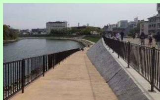
親水護岸整備(国交省)