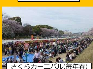
さくらカーニバル(毎年春)