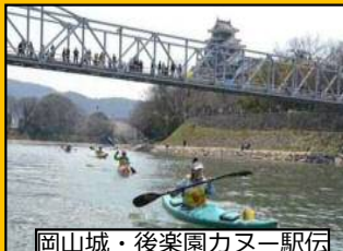
岡山城・後楽園カーニ駅伝