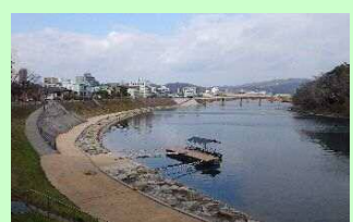
遊覧船が発着できる 親水護岸整備