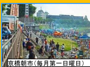
京橋朝市(毎月第一日曜日)