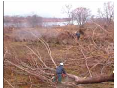
高梁川 総社市中原地先

河道内の樹木は、洪水の勢いを緩やかにしてその破壊力を弱める機能、多くの生き物のすみかとなる生息空間、良好な景観の形成など環境に優しい多様な機能を有しています。しかしその反面、洪水時における水位上昇や堤防付近の流速を速めるなど、治水上の支障となっている箇所もあります。また、河川の形状は様々で、川幅が広いところや狭いところがあります。こうしたことを踏まえ、川幅が狭く樹木によって流れを大きく阻害しているところで、環境への影響が少ないところを重点的に伐採するよう計画し、優先順位をつけて順次実施しています。また、伐採した樹木の処分費に多大な費用が必要なため、コスト削減を考え、適当な長さに切りそろえた伐採木を無料で配布することも実施しています。