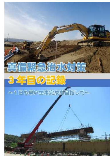
事業の紹介や工事の進捗状況をまとめた写真集を発行