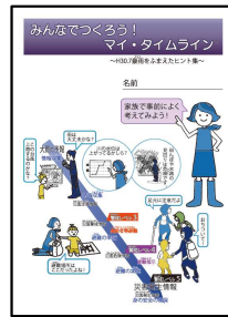
『逃げキッド』と真備版ヒント集