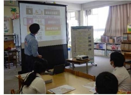
小学校での出前講座の状況