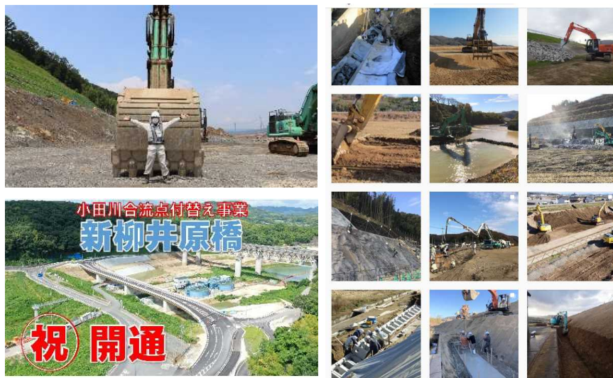
工事の進捗状況をInstagramやYouTubeで紹介

・「真備緊急治水対策プロジェクト」の事業開始年度から、事業の紹介や工事の進捗状況をまとめた写真集を毎年発行