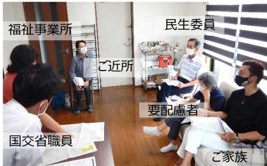
要配慮者マイ・タイムライン作成状況