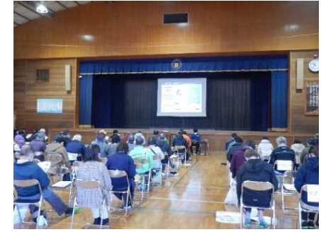
地域での防災に関する出前講座