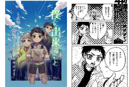
要配慮者マイ・タイムライン啓発漫画 『僕に出来ること』