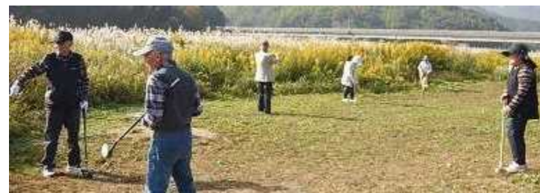
小田川河川敷での繁茂抑制の実験