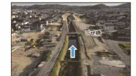
ござ橋周辺の進捗状況（令和4年11月撮影）