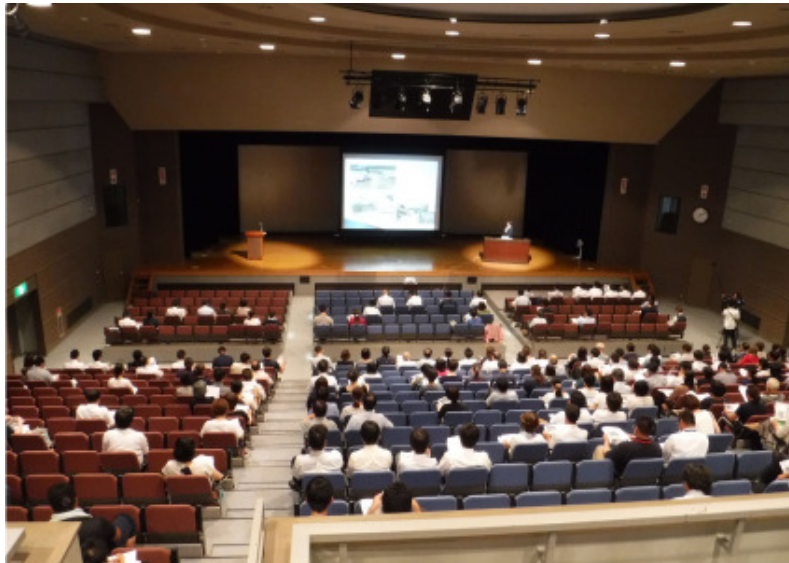
大規模災害対策セミナー

○岡山市では、「水防法」「土砂災害防止法」の改正により義務化された、要配慮者利用施設の避難確保計画の作成、避難訓練の実施に向け、要配慮者利用施設の所有者・管理者に対し「避難確保計画」作成の必要性を解説するセミナーを開催しました。