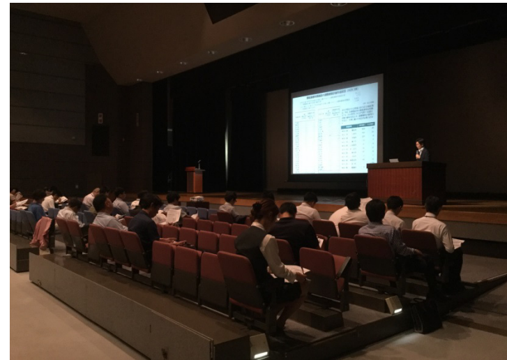
講師による避難計画作成ポイントの説明