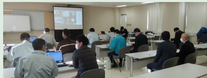
【会場(岡山河川事務所)の様子】

岡山市、津山市、瀬戸内市、赤磐市、 鏡野町、勝央町、美咲町、美作市、 中国電力株、中国電力ネットワーク株、 岡山県LPガス協会、岡山ガス株、 津山ガス株、テレビ津山株、 苫田ダム管理所、岡山地方气象台、 岡山県、岡山河川事務所 計18機関