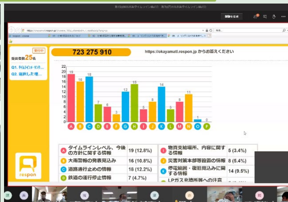
【リアルタイムアンケートの状況】