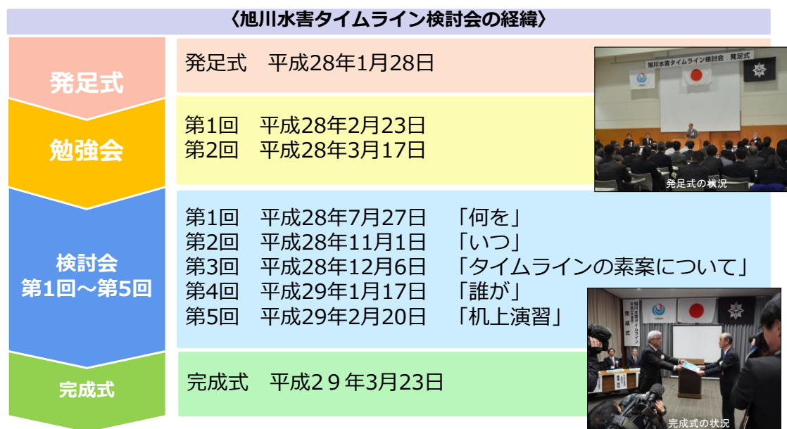
図 1 旭川水害タイムラインの経緯

旭川流域では平成28年1月に旭川水害タイムライン検討会を発足し、これまでに検討会を5回（うち机上演習1回）、ワークショップを2回行い、平成28年3月23日に旭川水害タイムライン《平成28年度版》が完成しました。