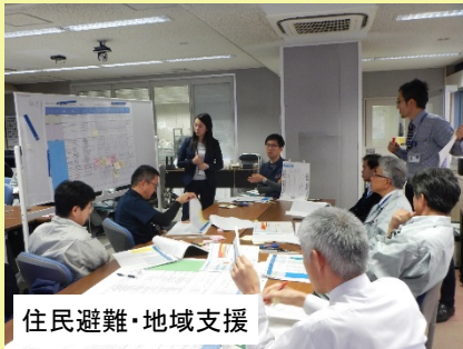
住民避難・地域支援