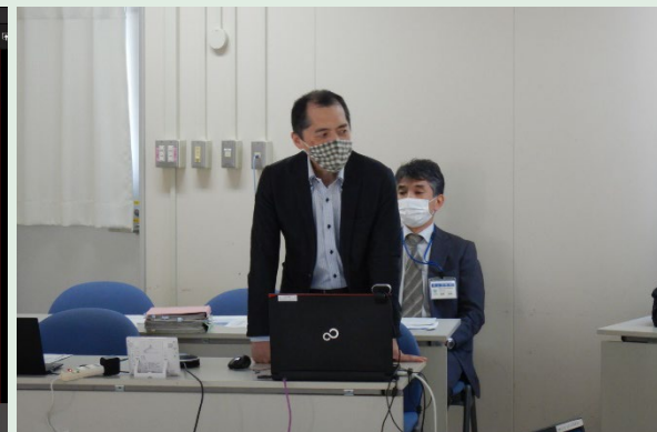
【座長 西山教授による講評】