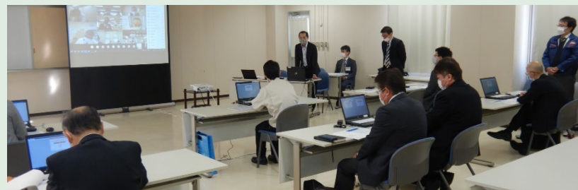
【会場(岡山河川事務所)の様子】

倉敷市、笠岡市、井原市、総社市、高梁市、新見市、浅口市、矢掛町、中国電力(株)、西日本電信電話(株)、(一社)岡山県LPガス協会、岡山ガス(株)、西日本旅客鉄道(株)、テレビせとうち(株)、井原放送(株)、(株)エフエムくらしき、高梁川用水土地改良区、農林水産省中国四国農政局、広島県、高梁川・小田川緊急治水対策河川事務所、岡山国道事務所、岡山地方気象台、岡山県、岡山河川事務所 計24機関