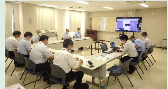
【会場(岡山河川事務所)の様子】

岡山市、津山市、備前市、瀬戸内市、赤磐市、真庭市、和気町、鏡野町、勝央町、奈義町、西粟倉村、美咲町、久米南町、倉敷市、笠岡市、井原市、総社市、高梁市、新見市、浅口市、早島町、里庄町、岡山県警本部、岡山地方気象台、中国電力(株)岡山支社、中国電力ネットワーク(株)、西日本電信電話(株)岡山支店、(一社)岡山県LPガス協会、岡山ガス(株)、(公社)岡山県バス協会、RSK山陽放送(株)、岡山放送(株)、テレビせとうち(株)、玉島テレビ放送(株)、笠岡放送(株)、矢掛放送(株)、高梁川用土地改良区、中国四国農政局、山陽SC開発(株)(岡山一番街)、岡山県、広島県土木建築局、岡山河川事務所、岡山国道事務所、苫田ダム管理所 計49機関