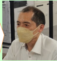
西山座長 (吉井川・高梁川)

既に出水期に入っており、来週から大雨が降る可能性も十分想定される。各機関で防災行動への意識を高めて頂くとともに、防災行動の確認を引き続き取り組んで頂きたい。 (西山座長)