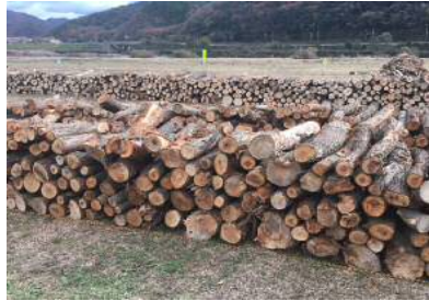
配布予定の伐採木