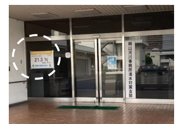
貯水率の掲示内容