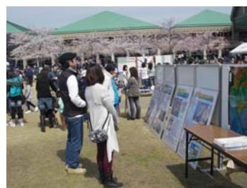
34 イベント内での河川事業紹介 (操明桜祭り)