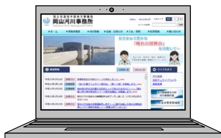
34 岡山河川事務所ウェブサイト

23 そのため、岡山河川事務所ウェブサイト、各種広報誌等を通じて、旭川の河川整備状況や自然環境の現状等に関する情報を広く共有するとともに、施設の見学会、説明会、出前講座等、地域住民等に直接説明して理解を深めることに努め、意見交換の場づくりを図る等、関係機関や地域住民等との双方向のコミュニケーションを推進します。