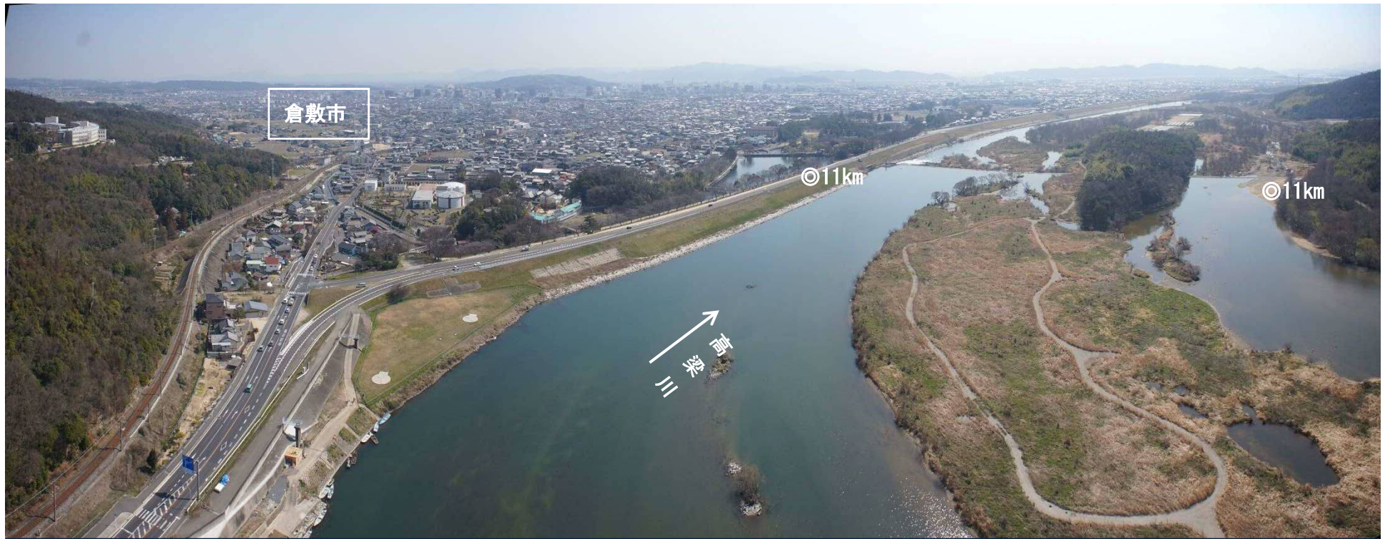
高梁川 34 11 km ~ 12 km 付近詳細