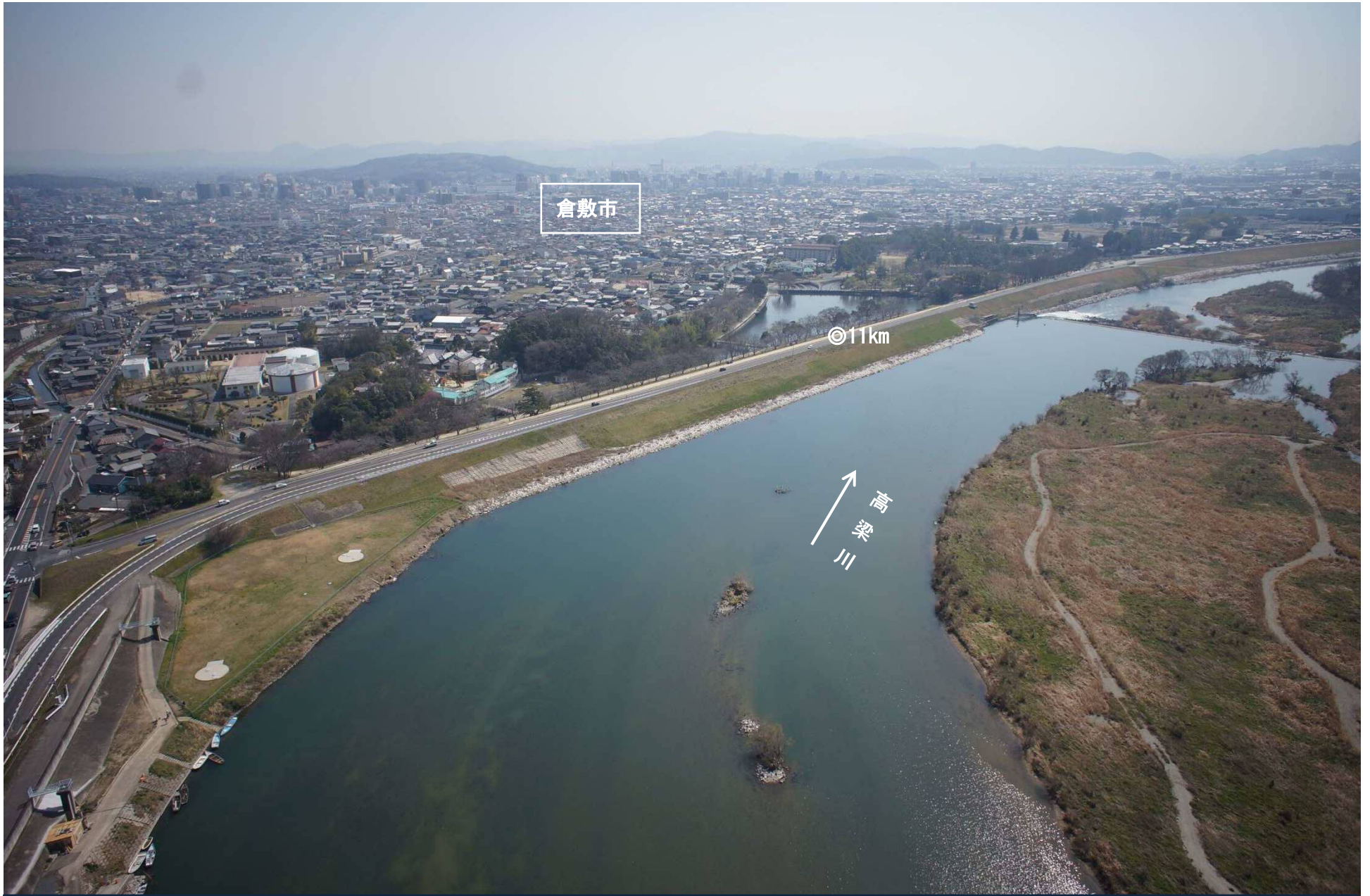
高梁川 32 1.1 km ~ 1.2 km 付近詳細