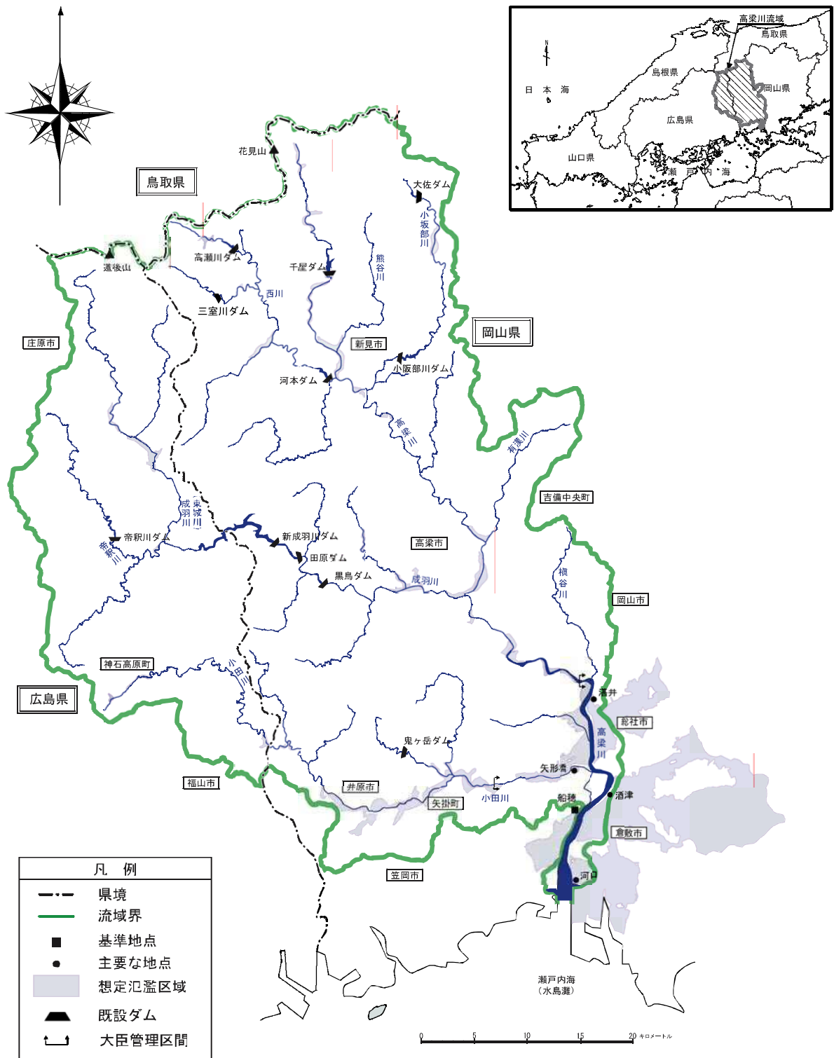
(参考図) 高梁川水系図