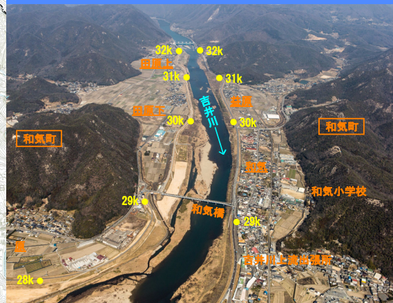
⑥ 吉井川28k~32k付近(金剛川合流部箇所)