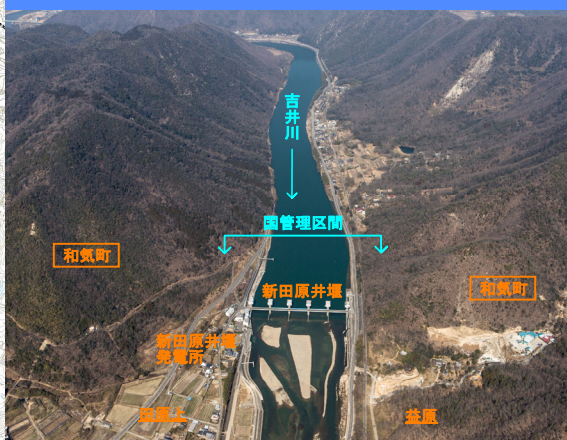
⑦ 国管理区間上流端付近(新田原井堰)