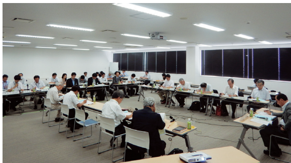
【第4回 明日の吉井川を語る会の様子】

今後も引き続き、ご意見を伺いながら、河川整備計画の策定に向けて、検討を進めていきます。