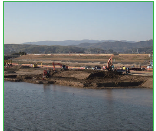
工事進捗状況 (平成31年1月末現在)