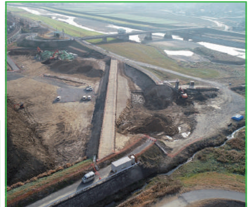
工事進捗状況 (平成31年1月末現在)