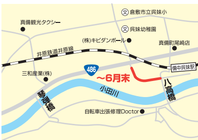
琴弾橋～八高橋 区間

下記のとおり、一般車両の通行ができなくなります。 ご利用の皆様には、ご不便・ご迷惑をおかけしますが、 何卒ご協力お願いします。