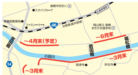
宮田橋～箭田橋～福松橋 区間