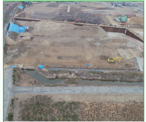
工事進捗状況 (平成31年1月末現在)