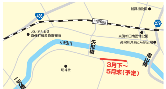
二万橋～矢形橋～南山橋 区間