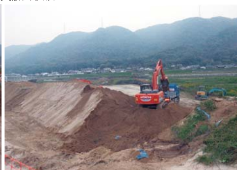
荒締切堤撤去状況