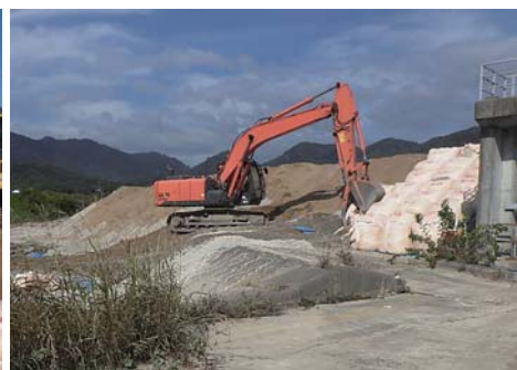
大型土のう撤去状況