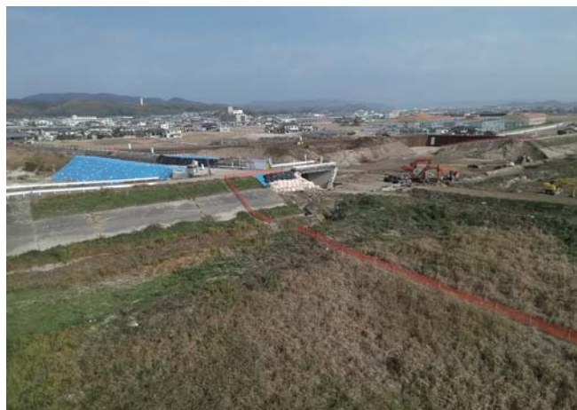
仮設堤防の土のう（左）、撤去後（右）