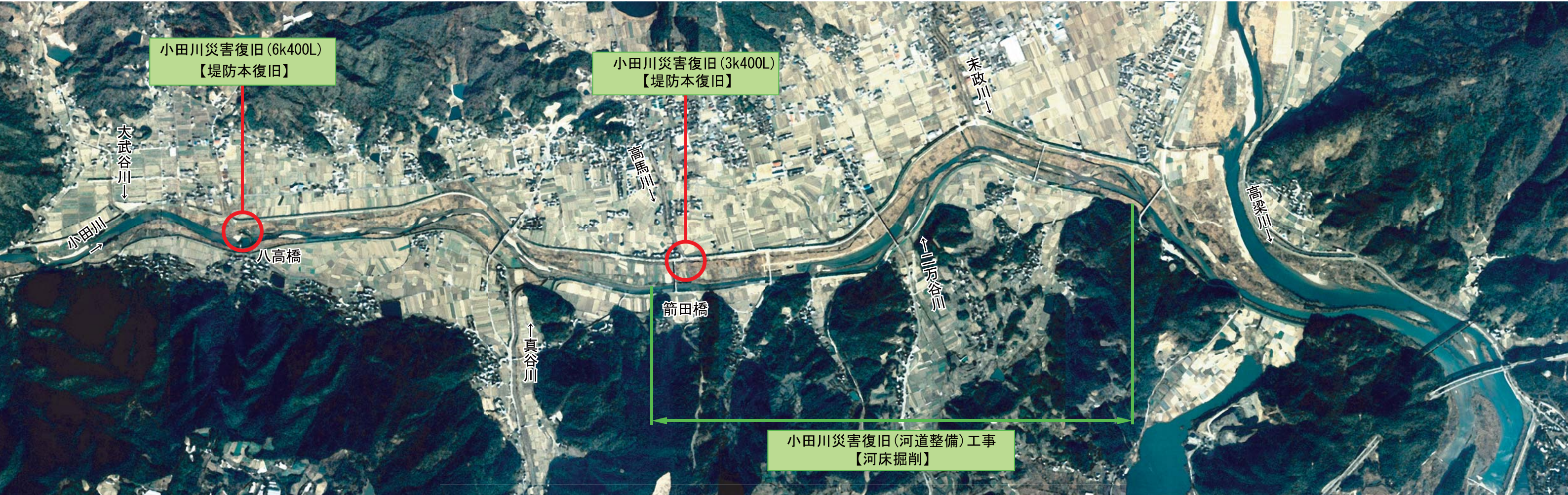
【小田川流路概略図】