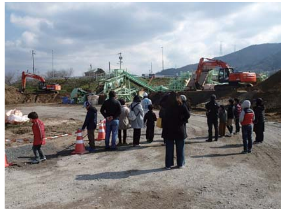
真備町の方々による見学状況

◎2月2日（土曜日）に『箭田の町作り協議会』の方17名が、堤防復旧の工事進捗状況と工事内容に興味を持たれ、現場見学に足を運んでくださいました。