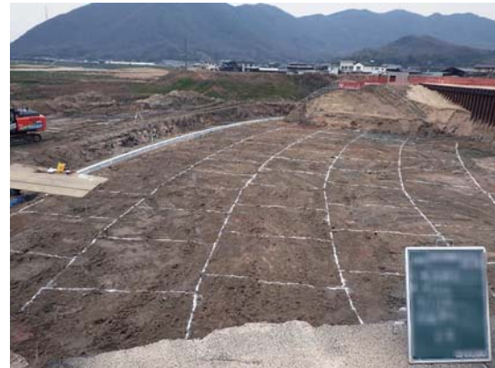
破堤箇所復旧作業（築堤盛土施工状況）

◎護岸基礎部の矢板打込み、ベースブロック設置作業も終え、堤防復旧の基盤浅層改良も終了して、築堤盛土を施工しています。