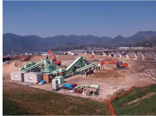
盛土材改良プラント稼働状況

◎1月末より回転式混合方式の盛土材改良プラント稼働を開始しました。河道整備工事より河床掘削土の搬入が始まり、これより改良土の製作を行います。この土は、上流維持工事の現場に搬出し、小田川の復旧工事に利用されています。