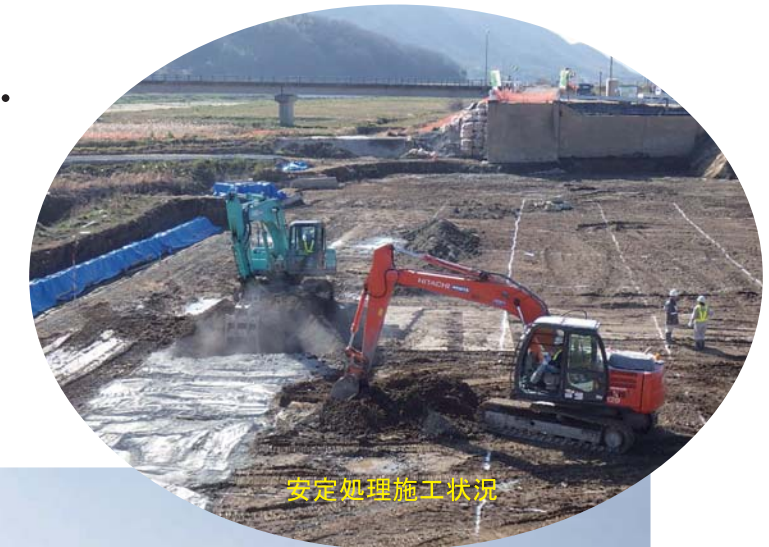
安定処理施工状況